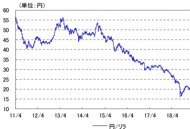
トルコ・リラ 為替レート 2011/04/01～2019/01/31