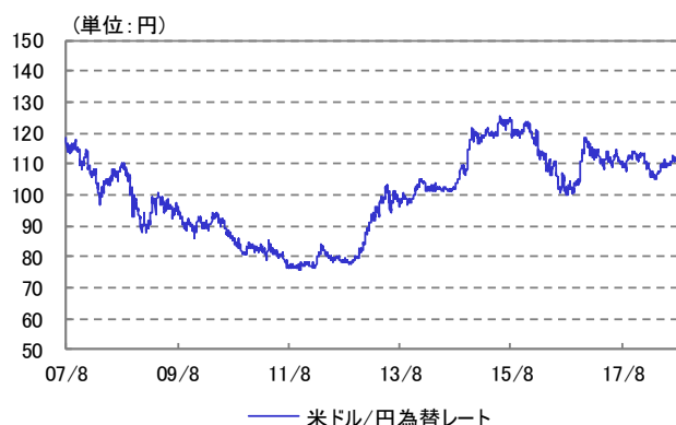
米ドル/円 為替レート 2007/08/13~2018/09/28

※ 設定時2007年8月13日を10,000として指数化しています。 ※ 2016年8月23日まではドイツ銀行グループ商品指数(円建て為替ヘッジなし)を、2016年8月24日からはCRB指数(円建て為替ヘッジなし)を指数化しています。