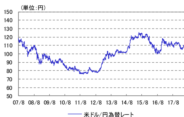
米ドル/円 為替レート 2007/08/13~2018/06/29